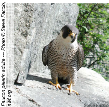
Faucon pèlerin adulte

L'utilisation des pesticides organochlorés, comme le DDT, dès la fin des années 40, dans le but d'exterminer des insectes et des parasites considérés nuisibles, a eu de graves répercussions sur les populations de plusieurs espèces animales non visées par ces produits. Le faucon pèlerin fut l'une des victimes les plus connues de l'épandage de ces pesticides. Des trois sous-espèces de faucons pèlerins rencontrées au Canada, la sous-espèce anatum a été la plus sévèrement touchée, et tous les sites de nidification connus dans le Québec méridional étaient désertés au début des années 1970.