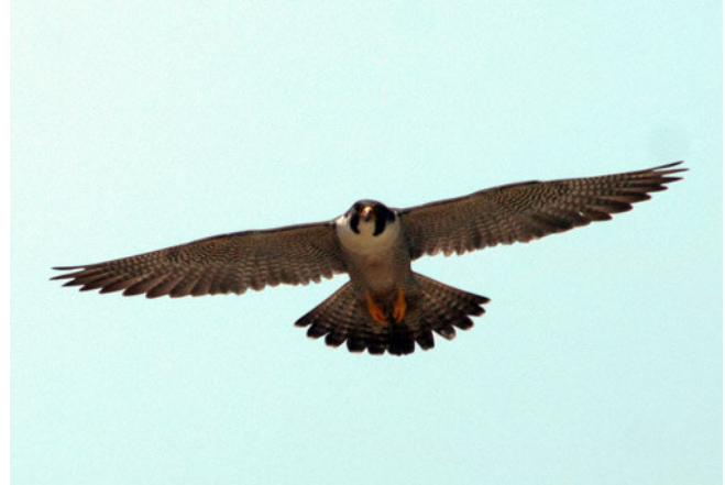
Faucon pèlerin

Face à cette situation, un programme pancanadien fut mis sur pied dès 1976 afin de contrer la chute drastique des populations de cette sous-espèce. Le programme de réintroduction a connu un grand succès et la situation de la sous-espèce anatum au Canada et au Québec s'est améliorée au point que son statut au niveau canadien est passé de « en voie de disparition » à « menacé » puis à « préoccupant » en 2007. Ainsi, et malgré une nette amélioration, la situation du faucon pèlerin demeure encore relativement précaire.