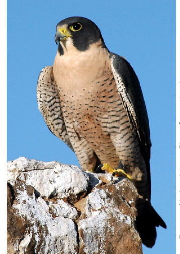
Faucon pèlerin adulte

En milieu naturel, le faucon pèlerin niche principalement sur les falaises ou dans des escarpements. Il ne construit pas de nid, mais s'installe plutôt directement sur les corniches naturelles, dans des dépressions peu profondes, sur la terre ou le gravier. Le nid est généralement localisé à partir de la moitié ou du tiers supérieur de la falaise. La présence d'espaces ouverts à proximité du site de nidification est chose commune, car les faucons pèlerins peuvent chasser efficacement leurs proies, c'est-à-dire des oiseaux qu'ils capturent en vol (ex. canards, bécasseaux, carouges à épauettes, etc.). Cette espèce s'adapte facilement à des sites urbains, nichant par exemple sur la structure des ponts ou gratte-ciel, surtout s'il y a présence d'un cours d'eau à proximité.